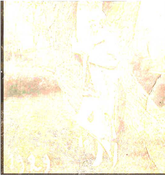
Besser situierte Großstadtdame zur Sommerfrische (1929): Dem Publikum mit Niveau baute der Schönauer Badbesitzer 1930 ein betoniertes Bassin.