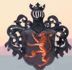
Wappen der Vögte von Weida (Osterburg): Goldener Löwe auf schwarzem Grund. rnk

Erkenbert (I.) von Weida urk. 1122 † vor 1143