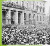
Preußisches Abgeordnetenhaus, Berlin, Dezember 1918