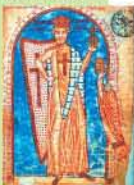
Miniatur aus einer Handschrift von 1188, Vatikanische Bibliothek

Friedrich I., Barbarossa, deutscher Kaiser von 1155 - 1190