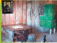
Wartburg, Eseltreiberstübchen (Lutherzimmer)