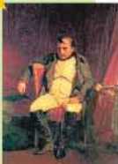
Napoleon I., 1814, Ölgemälde von Paul Delaroche