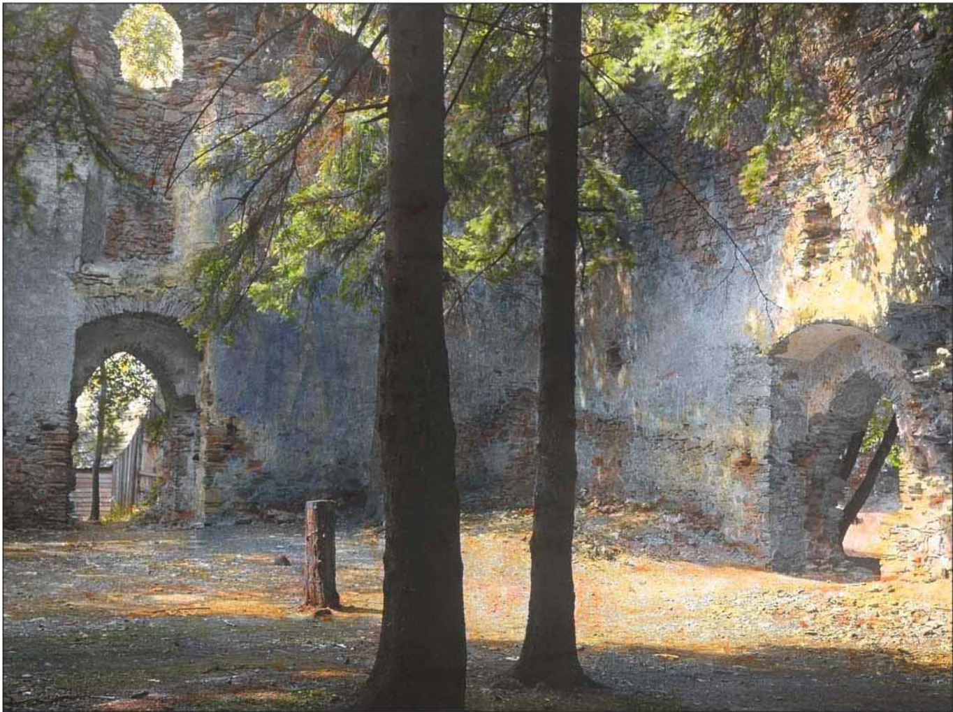
Untere Ruine (Dia, Glas, 1930er Jahre): Ausgewachsene Fichten ragen aus dem Kirchenschiff.