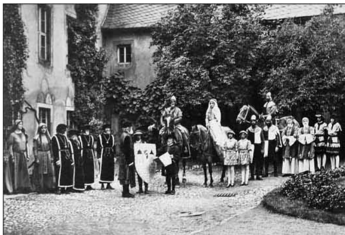
Aufwändig inszeniert (1934): Die Gruppe aus dem Festzug spielt die Verleihung des Stadtrechtes nach.

Die Mauer wurde 1430/31 fertiggestellt. Die Mauer hatte eine Länge von 1.200 Metern und eine Höhe von 10 Metern. Die Mauer wurde aus Ziegeln und Steinen erbaut. Die Mauer hatte vier Tore. Die Tore waren mit Türmen besetzt. Die Mauer wurde 1430/31 fertiggestellt.