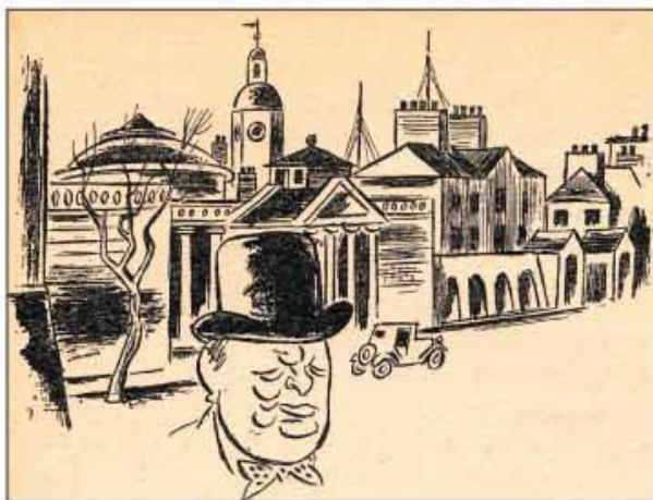
Ohser, der Illustrator: Eine von 15 „E.O.Plauen“-Zeichnungen für das Buch „Das war London. Glanz und Elend der größten Stadt der Erde“, das 1942 erschien.

Abbildung: Gerhard-Stalling-Verlag Oldenburg/Berlin